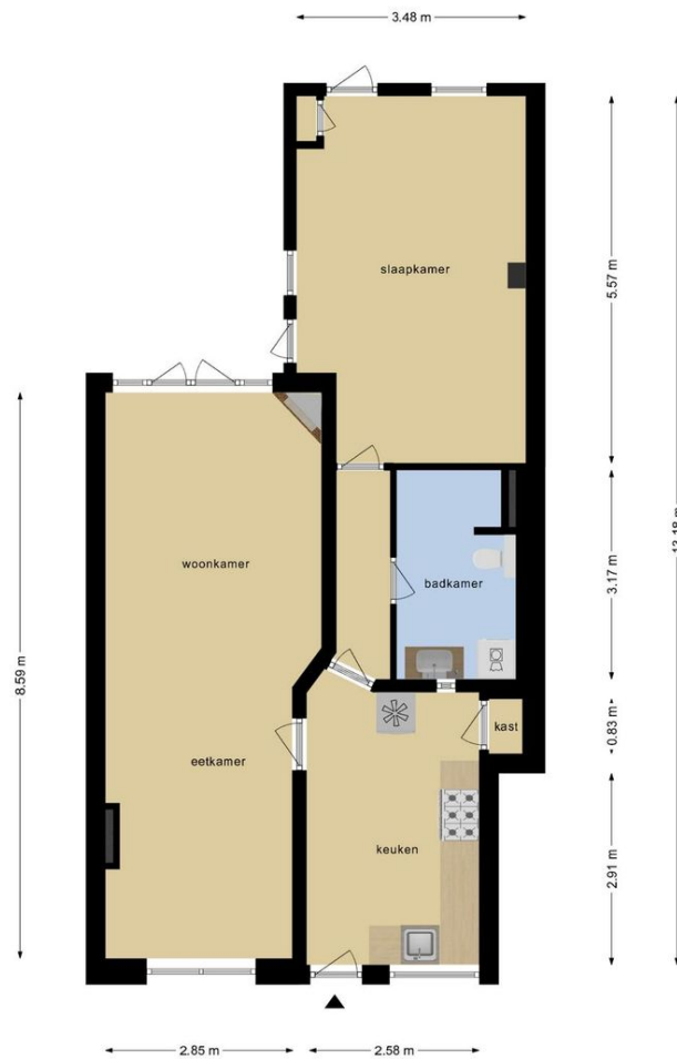
Deze plattegronden zijn opgemaakt voor indicatieve doeleinden. Hieraan kunnen geen rechten worden ontleend.