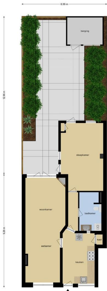
Deze plattegronden zijn opgemaakt voor indicatieve doeleinden. Hieraan kunnen geen rechten worden ontleend.