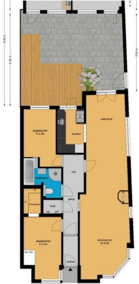
begane grond en tuin