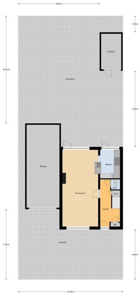
Begane Grond Tuin